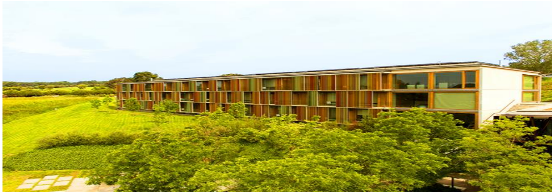
La Mola Hotel & Conference Center

Dirigit a: Tots els agents del sector Salut Mental.